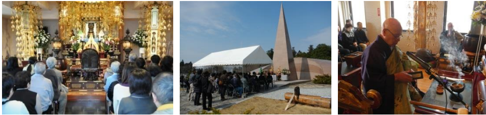
彼岸会スケジュール表